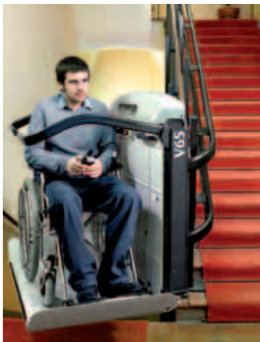
Il servoscala V65 assicura comfort e sicurezza su ogni tipo di percorso